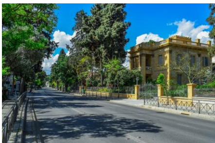
Το Φεστιβάλ για την ανάπτυξη επιχειρηματικών ικανοτήτων στην προσχολική εκπαίδευση θα πραγματοποιηθεί στη Λευκωσία, τον Ιούνιο του 2020.