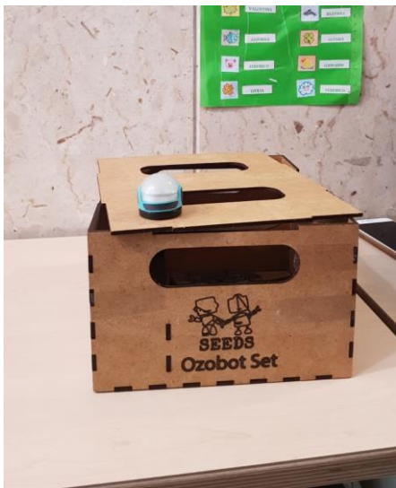
Το κουτί φύλαξης υλικών για τα Ozobot, στο Παλέρμο της Ιταλίας.