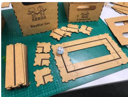
Forberedelse af Bee-bot- og Ozobot-kasser i Bremen, Tyskland.

Danmark: De sidste måneder har der været travlt i Vejle med masser af spændende og forskellige nye aktiviteter. Den ene er opbygningen af et naturvidenskabsområde til eksperimenterende og udforskende læring på Mælkebøtten. Hos Gaia har børnene og pædagogerne arrangeret deres årlige diskofest for børnene. Naturvidenskab har også været et emne på Paddehatten, hvor børnene har arbejdet med et emne kaldet "Verden ifølge Bille". Derudover har børnene i Gadkjærgaard bygget deres egne robotter af genbrugsmateriale og arbejdet med en ny slags digital robot kaldet Tinkerbot. I Skibet Børnehus har de også eksperimenteret med Tinkerbot-robotterne, og begge steder har fremgangsmåden været, at børn introducerer andre børn i hvordan de fungerer.