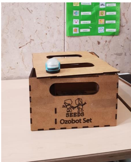
Ozobot-sæt i Palermo, Italien.